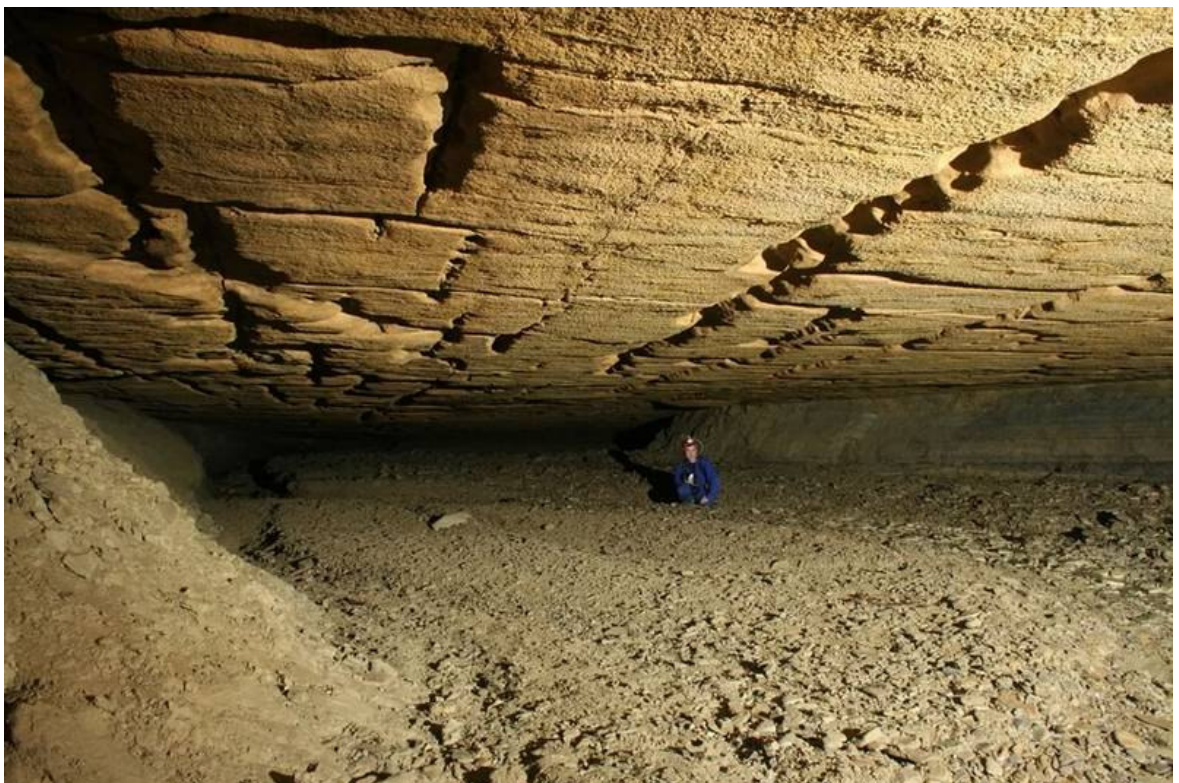
Slika 3. Špilja Piskovica 2