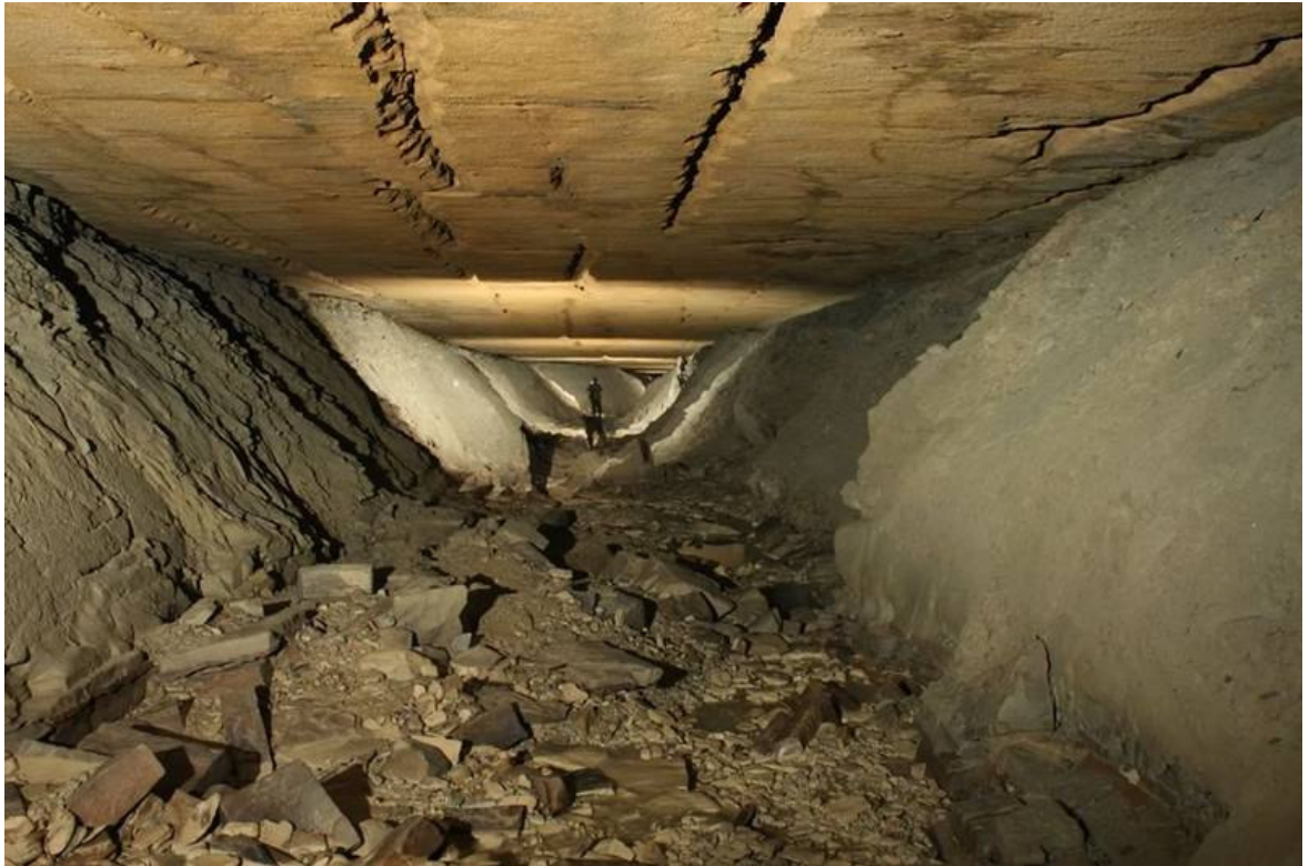
Slika 2. Špilja Piskovica 1